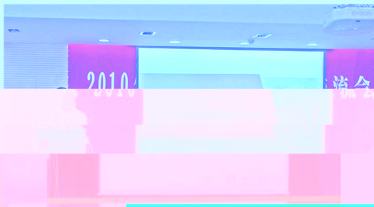
图 1 会场全景

会议第三阶段为学院2010年度工作总结，由工会主席岳昌君老师主持。党委书记陈晓宇老师代表学院党委对学院的党务情况进行介绍，并从理论学习、基层党建、党委换届、学生工作、群团工作、后备干部工作、党风廉政建设等方面，对学院的党务工作进行系统、全面的汇报；文东茅院长代表学院全体行政领导班子对年度行政工作进行总结，着重介绍了学院